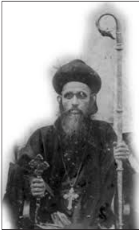
കല്ലാശേരി ഗീവർഗീസ് മാർ ഗ്രിഗോറിയോസ് മെത്രാപ്പോലീത്താ (1912)

വാഴിച്ചപ്പോൾ പാത്രീയർക്കീസ് ഈ വടി കൊടുത്തു. 1951-ൽ താൻ സഭാ മേലദ്ധ്യക്ഷനായപ്പോൾ ഇതെന്റെ പക്കലേത്തി... എന്നാണ് അഭിമുഖത്തിൽ അദ്ദേഹം പറയുന്നത്. മുകളിൽ പ്രസ്താവിച്ച വസ്തുതകൾ കൂടാതെ ഈ ലേഖനത്തിൽ ഒരു