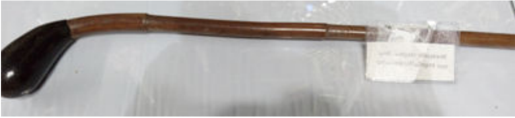
പ. പരുമല തിരുമേനിയുടെ മല്പാൻ വടി

സ്ഥാനാരോഹണവേളയിൽ സമ്മാനിച്ചത് എന്ന പിൽക്കാലവാദം പൊളിയുകയും ചെയ്യുന്നു. പ. പരുമല തിരുമേനിയെപ്പറ്റി യാതൊരു പരാമർശനവും ഇതിൽ ഇല്ലെന്നതും ശ്രദ്ധേയമാണ്.