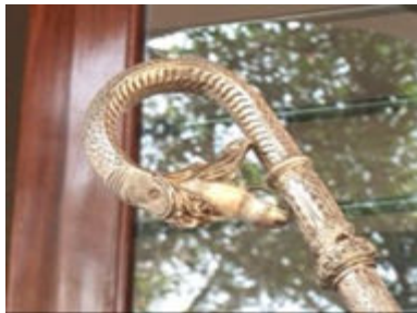
പാമ്പാടി ദയറായിൽ സൂക്ഷിച്ചിരിക്കുന്ന പ. പരുമല തിരുമേനിയുടെ അംശവടി