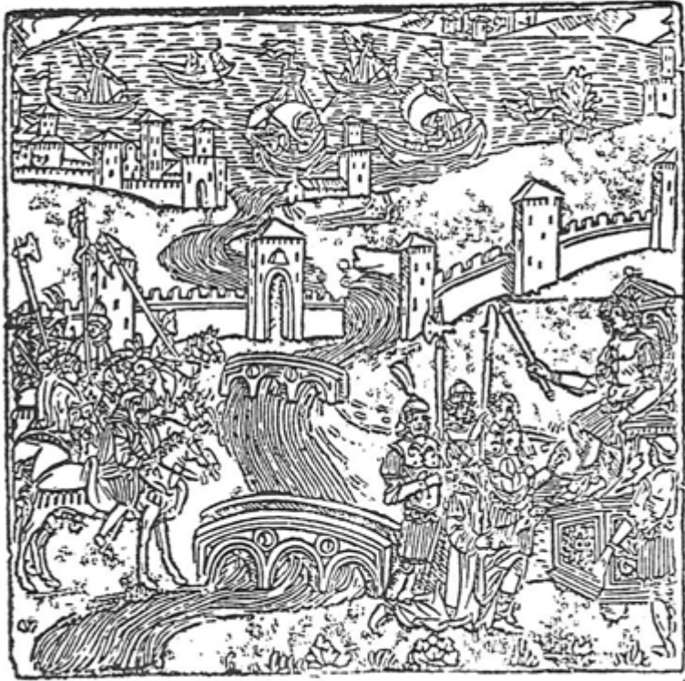
Title page of Paesi 1508 (Cf. p. 303, 1.2.5. p. 16. 1.1.1. p. 5).

Paesi nuovamente ritrovati, & Nuovo Mondo da Alberico Vesputio Fiorentino intitolato.