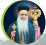
The Late H.H. Baselios Marthoma Mathews II Catholicos of the East & Malankara Metropolitan Founder Chairman

Lake View, Sasthamcotta, Kollam, Kerala 690 520