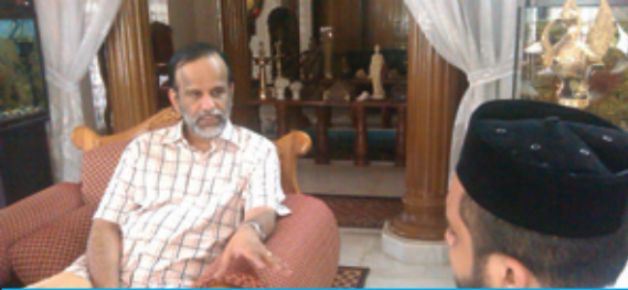
35-ാം പേജിൽ നിന്നും...

ഉത്തേജിപ്പിച്ചേ മതിയാകും. അവരെ സ്വാധീനിക്കേണ്ടി വരും. ഒരു ഡോക്ടർ എപ്പോഴും 'ബാലൻസ്ഡ്' ആയിരിക്കണം. അല്ലെങ്കിൽ രോഗി മരിച്ചാൽ ഡോക്ടർ തകർന്നു പോകും. ചെയ്യാൻ പറ്റുന്നത് മാത്രം ചെയ്തു കൊടുക്കുന്നു, എന്ന ചിന്ത എപ്പോഴുമുണ്ടാവണം.