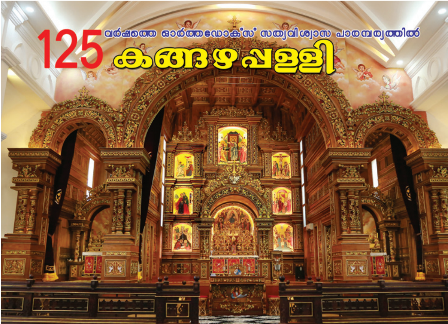
ഇറത്താഴും, കുടേഴ്കുരിശിനും സമന്വയിപ്പിച്ചിരിക്കുന്ന വി. മദ്ബഹാ ചമയം