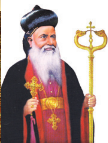
പുലിക്കോട്ടിൽ ജോസഫ് മാർ ദിവന്നാസിയോസ് അഞ്ചാമൻ 106-ാം ഓർമ്മ കോട്ടയം പഴയ സെമിനാരിയിൽ, ജൂലൈ 12-ന്