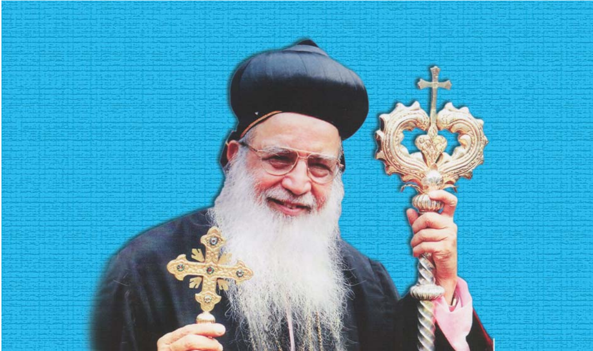
ആർദ്രയുടെ സ്ഥാപകൻ, ഭാഗ്യസ്മരണാർഹനായ മാത്യൂസ് ദ്വിതീയൻ കാതോലിക്കാ ബാവാ തിരുമേനി