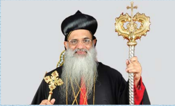
H.H. Baselius Marthoma Paulose II Catholicose of the East & Malankara Metropolitan