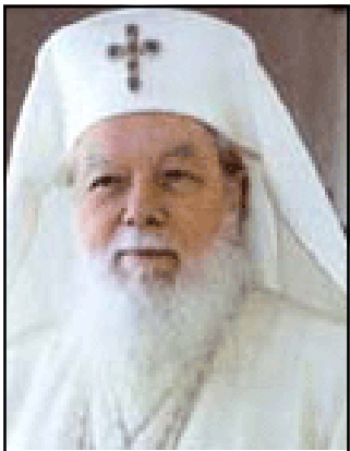
റുമേനിയൻ പാത്രീയർക്കീസായിരുന്ന തിയോക്സിസ്

ഡോ. ഫിലിപ്പോസ് മാർ തേയോഫിലോസ്, ഡോ. പൗലൂസ് മാർ ഗ്രിഗോറിയോസ് തുടങ്ങിയ പ്രഗൽഭരായ മെത്രാപ്പോലീത്താമാരുടെ കാലത്ത് അന്തർ സഭാ ബന്ധ സമിതി സജീവമായിരുന്നു.