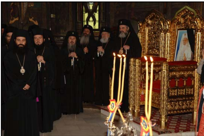
റുമേനിയൻ ഓർത്തഡോക്സ് സഭയുടെ പുതിയ പാത്രീയർക്കീസായ മോൾഡാവിയായിലെ ദാനിയേലിന്റെ സ്ഥാനാരോഹണം